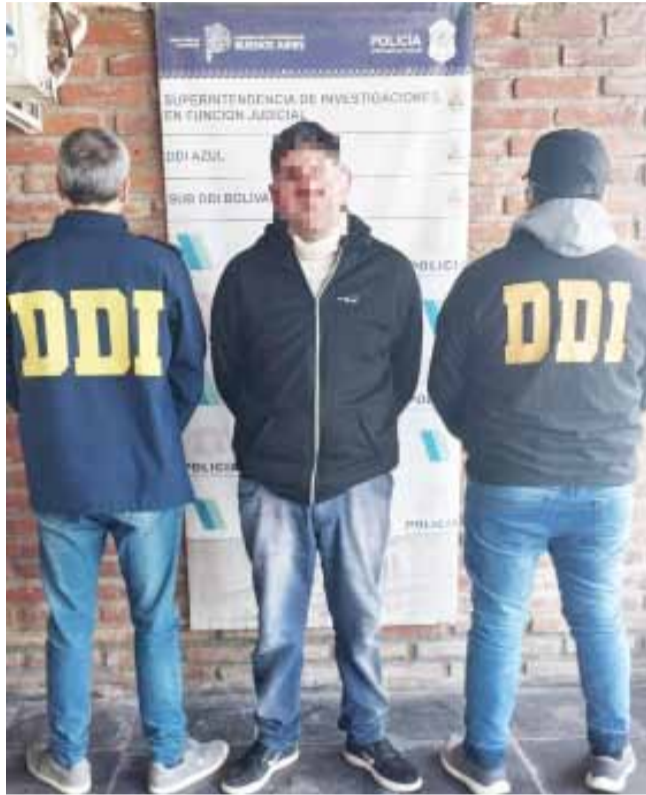
drada. Luego de que la propietaria del comercio viralizó algunas imágenes de video, y después que la policía allanó el domicilio del imputado y el de su hija, el delincuente decidió au-

en la vereda del comercio, sin llevarse nada. Por la gravedad del hecho, sumado a los antecedentes penales del imputado, cuya participación en otros hechos de similares características se encuentra siendo investigada por los efectivos de la Sub DDI y atendiendo a la peligrosidad social del acusado, el magistrado, previo merituar todas las pruebas recolectadas por los investigadores, hizo lugar a la medida privativa de la libertad. Los efectivos dependientes de la Sub DDI para lograr su detención pusieron a disposición de la Fiscal el trabajo de investigación, que incluyó la recolección y análisis de evidencia digital y de grabaciones de videos que permitieron de manera contundente probar la materialidad del hecho, y la llegada y huida del malhechor a bordo de una motocicleta de baja cilin-