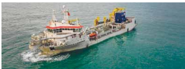
Hallazgo. De la draga Afonso de Albuquerque en el Río de la Plata

El aparato, que quedó a resguardo dentro de una tolva en un sector del predio de la Prefectura Naval Argentina, está siendo analizado por parte de peritos de la Dirección de Arsenales, dependiente del Ejército Argentino.