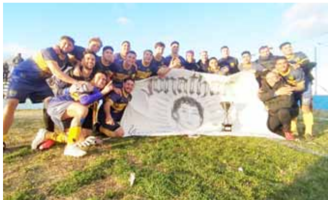
Festejo del cuadro azuleño en Olavarría.

Se terminó la hegemonía de los elencos olavarrienses en el torneo interligas de la Unión Regional. El domingo pasado, en la revancha decisiva de la competencia de este año, Boca de Azul se consagró campeón. El encuentro tuvo lugar en Olavarría, donde Ferro recibió al conjunto azuleño tras empatar sin goles en el partido de ida. En este caso ocurrió lo mismo, finalizaron igualados cero a cero y debieron recurrir a