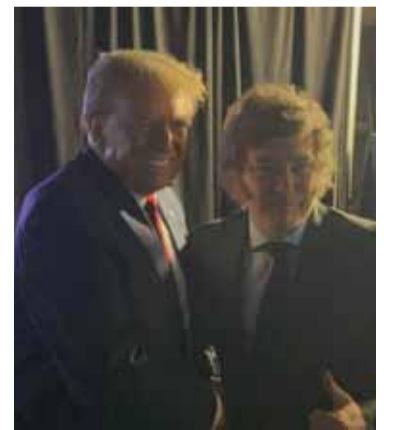
Juntos. Trump y Milei, meses atrás

“La nueva cabeza de un lugar llamado Argentina es genial. Él es grande, ya sabes, es genial. Es un gran fanático de MAGA (Make America Great Again).”