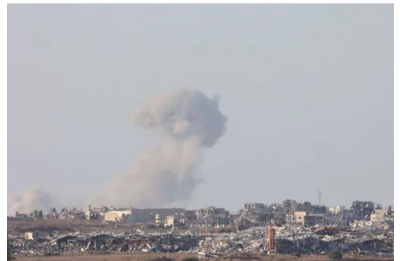
Oficina de la ONU. Ha registrado 21 ataques contra escuelas

Desde el 4 de julio, la Oficina de Derechos Humanos de la ONU ha registrado 21 ataques contra escuelas que sirven como refugios en la Franja, que han resultado en al menos 274 muertes, incluidas mujeres y niños, según la actualización.///