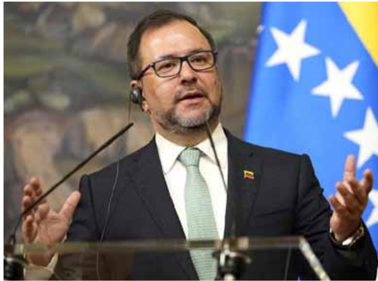
Diálogo ríspido. El canciller venezolano Yván Gil

A su vez, Gil respondió: “El Sr. Borrell ya fracasó una vez