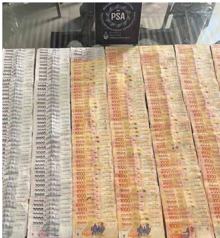
Dinero incautado. Secuestraron casi 3 millones de pesos en Santa Fe