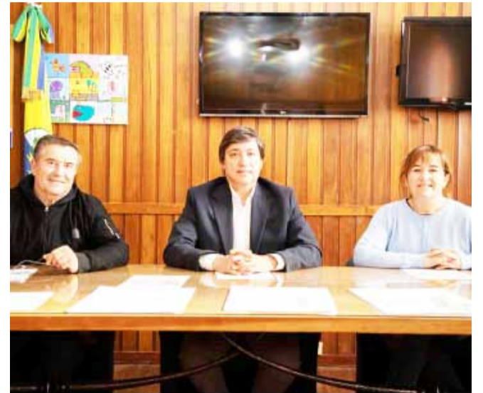
En caso de lluvia los festejos en todas las localidades quedarán suspendidos

En la ciudad de Daireaux, el Parque de diversiones será una de las principales atracciones con todos sus juegos gratis, sorteos de bicicletas y pelotas, la música estará a cargo de "El Rebaño" y habrá torta, chocolate y pochoclos gratis. Las actividades, como todos los años, se desarrollarán en el Parque Ing. Martín.