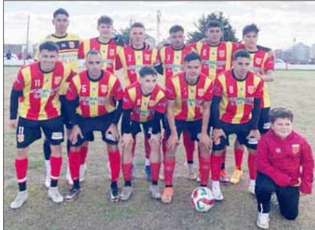
El "perro deroense" ganó y definirá de local.

Y en el predio "La Victoria" del Club Empleados, el triunfo también fue para la