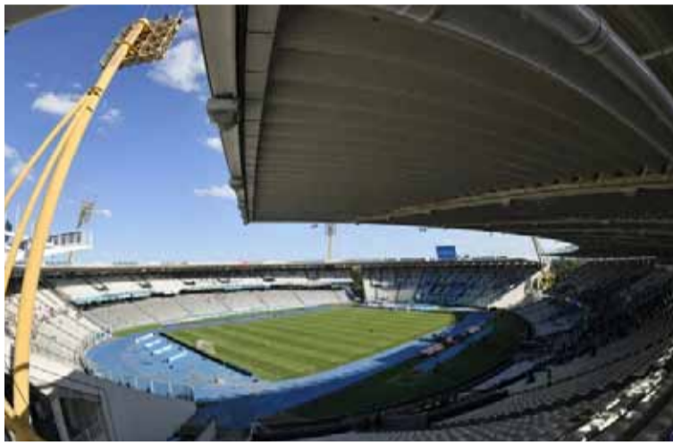
En el Kempes. Se juega el primer cruce de octavos de final de la Libertadores