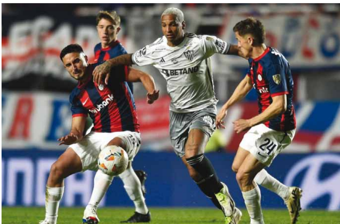
FUTBOL - COPA LIBERTADORES