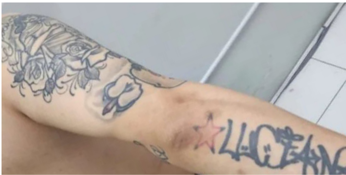
Tatuado. Una de las características que identifican al delincuente atrapado

El delincuente se encontraba prófugo desde el mes de marzo