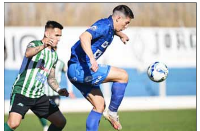
El elenco cordobés encontró el gol de la victoria en la última jugada del partido.

Mientras Ciudad de Bolívar quedó libre, este fin de semana se desarrolló la cuarta fecha de la Zona "Campeonato" del Torneo Federal A. En la Zona 1, se dieron mayormente empates; sólo el conjunto