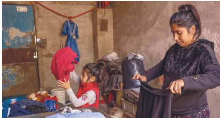
Doloroso informe. De Unicef sobre la realidad de la pobreza en el país

“En 9 de cada 10 hogares con niñas y niños, los ingresos no alcanzan para comprar la misma cantidad de productos básicos